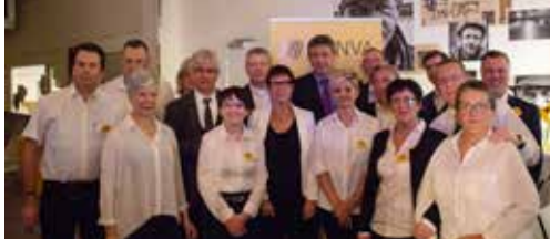
Jan Jambon in De Kruitfabriek p.2