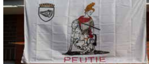
Peutie in de kijker p.3